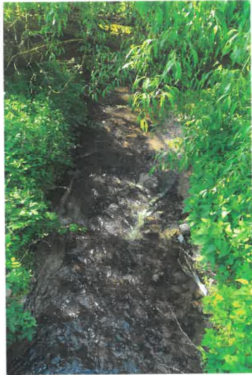
Fot. rzeka Targonka