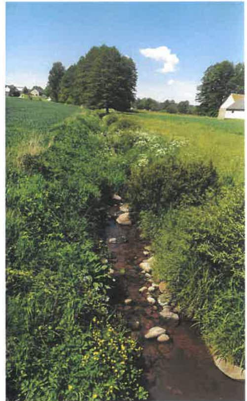
Fot. rzeka Kosódka