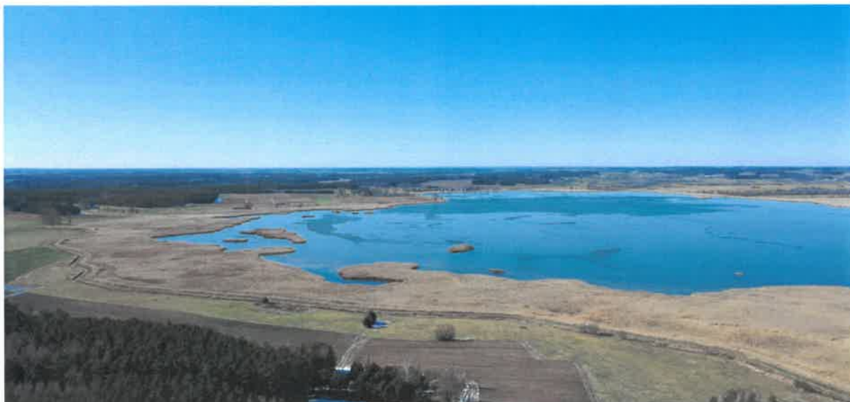
Fot. jezioro Augusta ( źródło: https://www.youtube.com/watch?v=itOnp8xSqow )