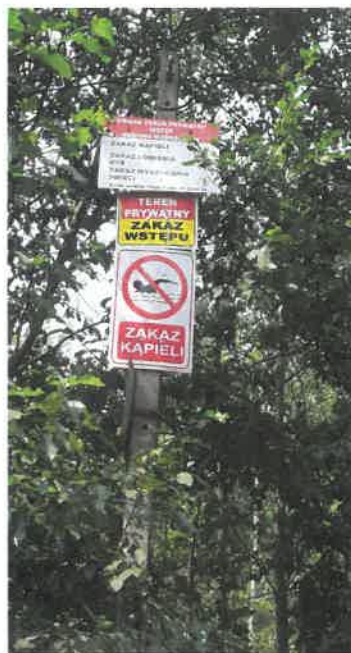
Fot. zbiornik wodny w miejscowości Żodzie