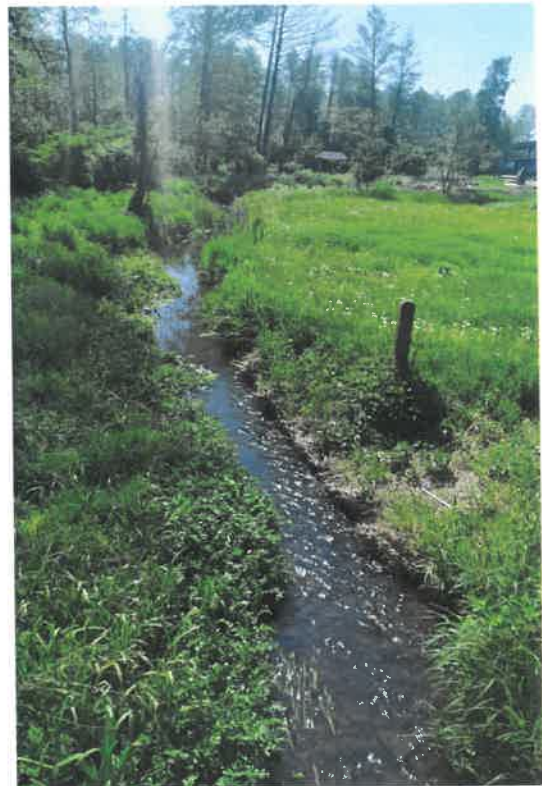
Fot. rzeka Rumejka