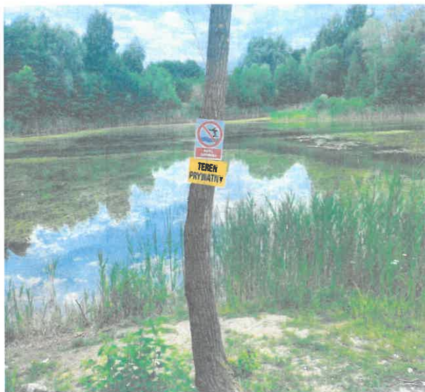
Fot. zbiornik wodny w miejscowości Hornostaje