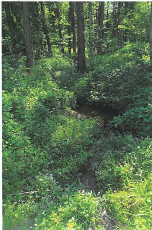
Fot. rzeka Golda