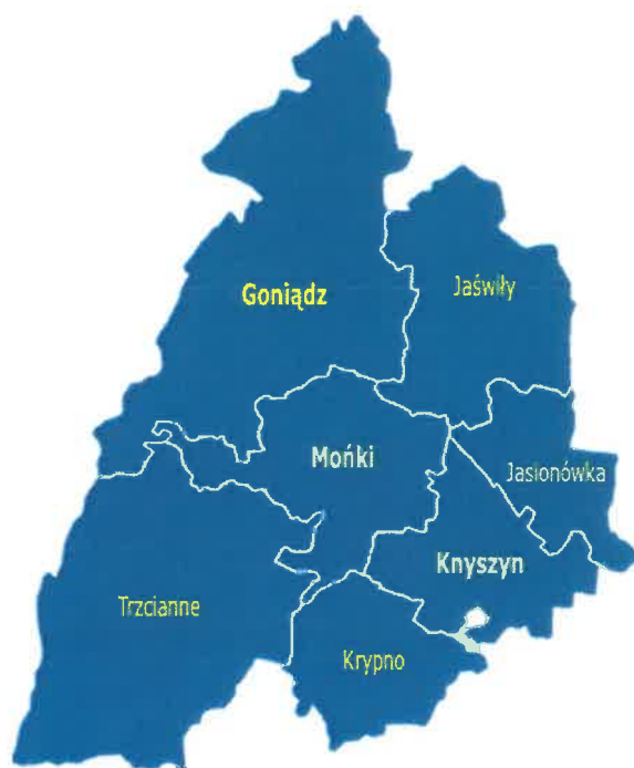
Mapa nr 1 - położenie Gminy Mońki w powiecie monieckim

Sieć osadniczą gminy tworzy miasto oraz 42 wsie, wchodzące w skład 41 sołectw.